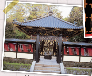
ずいほうでん 瑞鳳殿