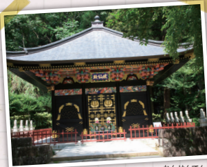
かんせんでん ▲感仙殿