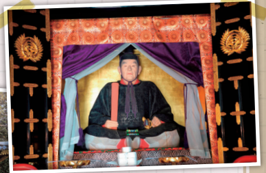
建物の中には伊達政宗の木像が安置されている