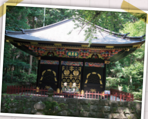
ぜん のう でん ▲善応殿